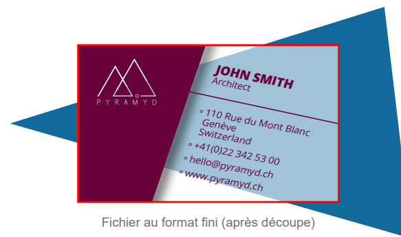
Fichier au format fini (après découpe)