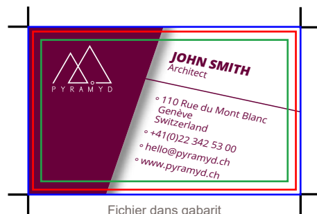
Fichier dans gabarit

Les éléments non imprimés de vos fichiers laissent apparaître la transparence du support papier